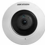
CAMARA OJO DE PEZ