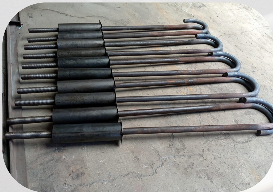
Fabricación de insertos, embebidos, etc