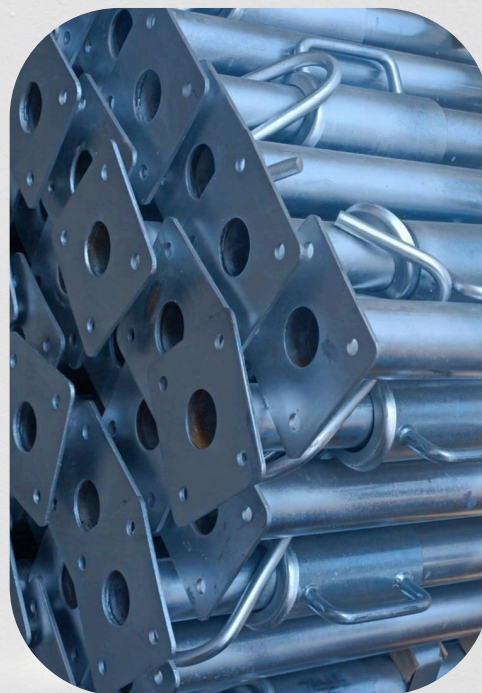
Fabricación de puntales