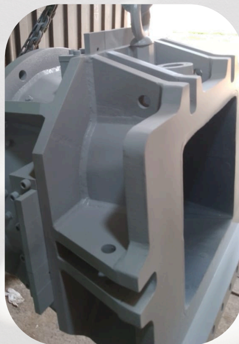
Molde de extrusora de cerámica