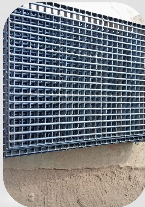
Fabricación de rejillas metálicas.