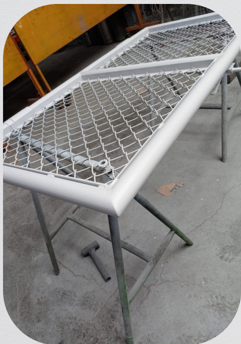
Fabricación de cerco perimétrico