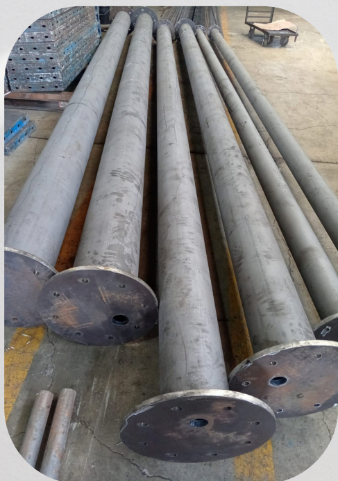
Postes metálicos para alumbrado