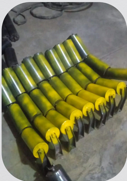
Fabricación de polines