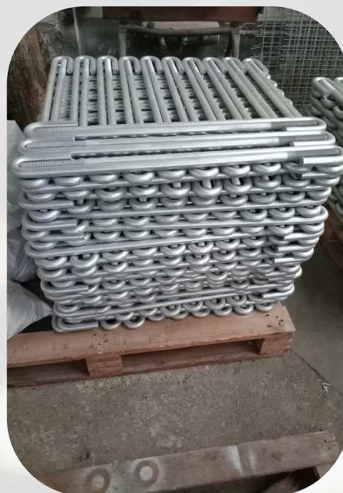
Fabricación de anclajes según diseño