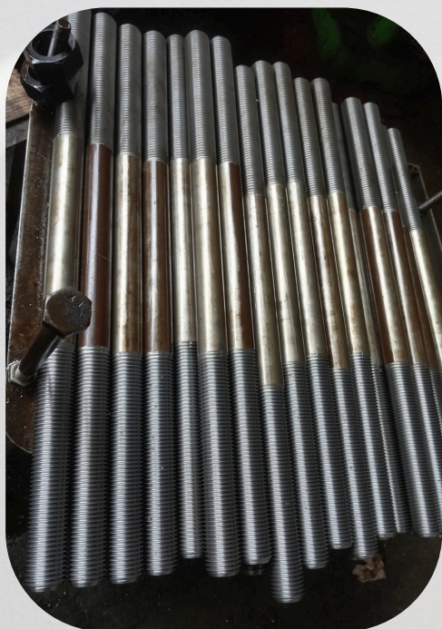
Fabricación de anclajes