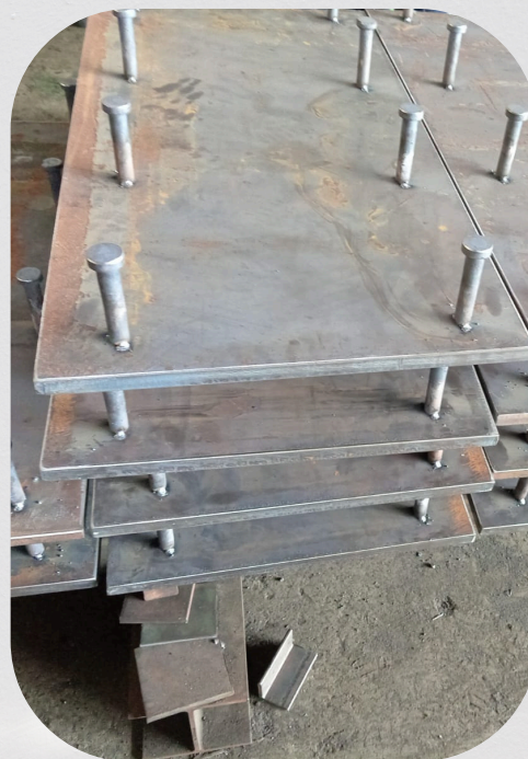
Insertos para embebidos con perno Nelson